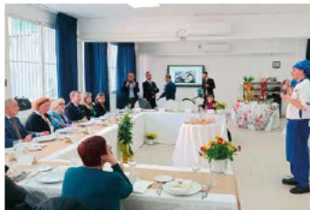
Settimana per la Prevenzione Oncologica: conclusione dell'evento presso l'Istituto A.E. Ferraioli