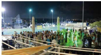
Circolo Canottieri Napoli "Serata sotto le Stelle"