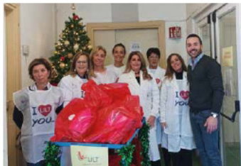
Festa degli Auguri: i volontari LILT in partenza con un carico di doni