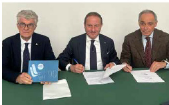
Firma del Protocollo d'intesa Circolo Posillipo / LILT

Sempre al nostro fianco gli storici amici Banca di Credito Popolare, Banca Stabiese, Idea Bellezza, Intesa Sanpaolo, Marinella, Sole 365 e la Taverna Anema e Core di Capri ai quali, come da consuetudine, si sono uniti per la tradizionale "Festa degli Auguri" dedicata ai pazienti dell'Istituto Tumori, riorganizzata in collaborazione con i Vertici del Pascale dal 2022 all'indomani della forzata interruzione causata dalla pandemia, De Nigris, Farmacie Internazionali-Erboristeria Mességué, La Doria, La Molisana, Idea Bellezza, Parnalat, St. Etienne ai quali esprimiamo la nostra gratitudine.