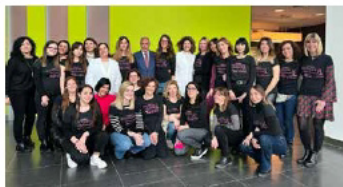
Prevenzione presso l'Azienda Carpisa