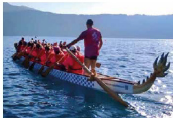
L'equipaggio delle Sirene Partenopee in allenamento